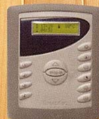
Digi II or Digi VII