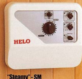
Steamy - SM